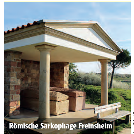
Römische Sarkophage Freinsheim