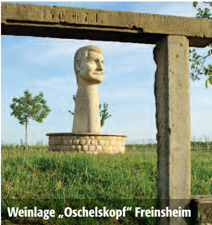
Weinlage „Oschelskopf“ Freinsheim