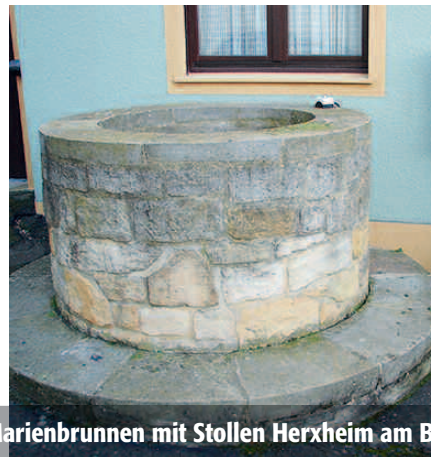
Marienbrunnen mit Stollen Herxheim am Berg