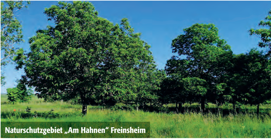
Naturschutzgebiet „Am Hahnen“ Freinsheim